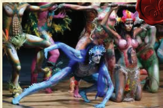
Expresión corporal.

Probablemente incluso antes de que se grabase la primera piedra, el hombre aplicaba pigmentos sobre su cuerpo para afirmar su identidad, la pertenencia a su grupo y situarse con relación a su ambiente. Esta práctica servía como instrumento de transformación; los dibujos y los colores permitían cambiar de identidad, señalar la entrada en un nuevo estado o grupo social, definir una posición ritual o reafirmar la pertenencia a una comunidad determinada, o se utilizaban sencillamente como ornamento. En el siglo XX en el occidente reaparece la pintura. Se trata de un arte transitorio, en el que el pintor crea un dibujo sobre su modelo